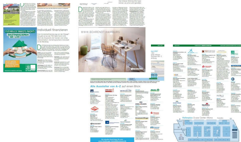
Layoutbeispiel Innenseiten des Messtablids 2017