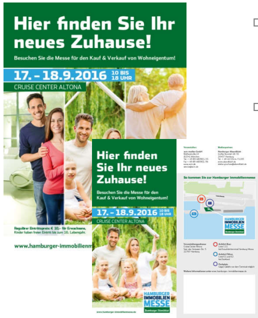
Plakatmuster aus dem Jahr 2016